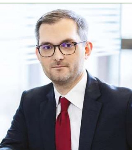
Marek Niedużak Wiceminister Rozwoju, Pracy i Technologii

Osoba wyznaczona na zarządcę sukcesyjnego musi wyrazić zgodę na objęcie funkcji. Gdy zarządcę sukcesyjnego powołuje przedsiębiorca, jego zgoda wymaga sporządzenia umowy pisemnej. Po śmierci przedsiębiorcy, zgoda zarządcy sukcesyjnego musi być wyrażona przed notariuszem.