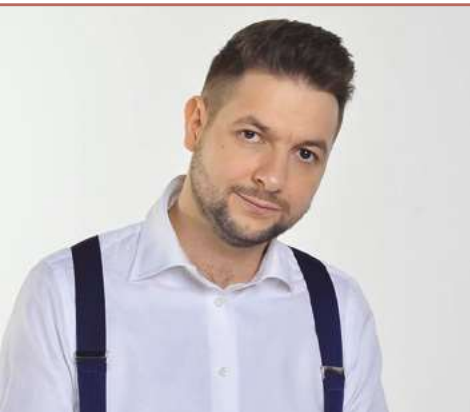
Patryk Jaki, europoseł i były wiceminister sprawiedliwości.

P.J. Cenzurowanie treści stało się niemal popularne na facebooku i twitterze. Ta ustawa jest więc po to, by bronić czegoś fundamentalnego dla państwa, cywilizacji zachodniej i Polski, tzn. wolności, wolności debaty czy wymiany myśli; bo jeśli mielibyśmy wrócić do sytuacji jaka była w PRL-u, gdy myśleć można było wszystko, pod warunkiem, że były to myśli komunistyczne, to osłabimy państwo. Z takimi tendencjami trzeba stanowczo walczyć.